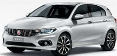
249 BIANCO GELATO PASTEL