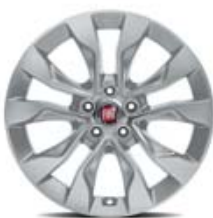
16" POP/EASY/LOUNGE 5P/SW