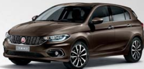
444 BRONZO MAGNETICO MÉTALLISÉ