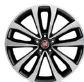
Jantes en alliage / Lichmetalen velgen Diamond Cut - 55E - en option sur / optie op Lounge