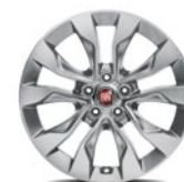
Jantes en alliage Lichmetalen velgen 1M1 - de série sur / standaard op Lounge