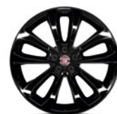
Jantes en alliage / Lichmetalen velgen 56J - de série sur / standaard op S-Design