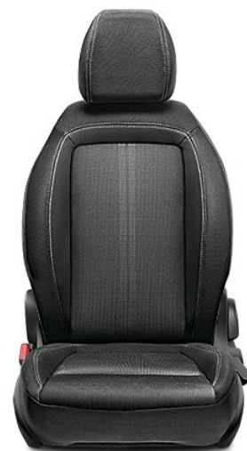
025 - S-DESIGN / SPORT Tissu / Stof Black / Grey