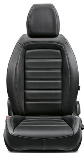
404 LOUNGE Cuir / Leder Black