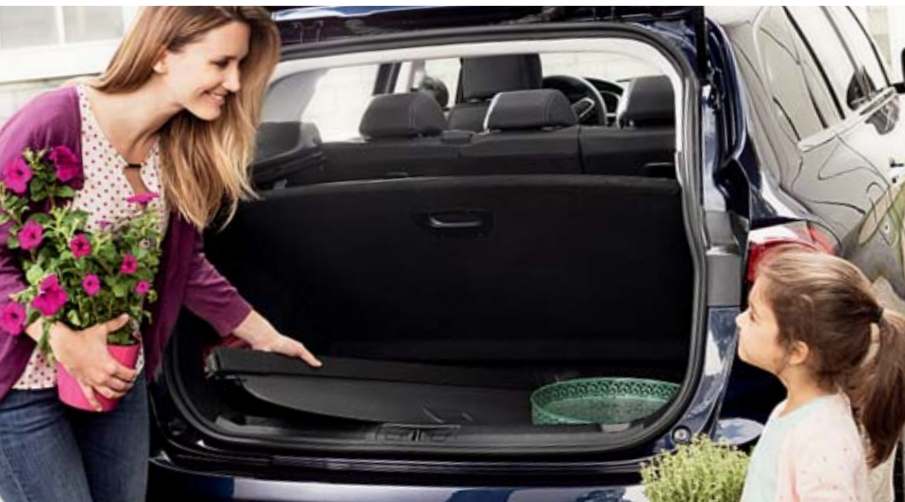
Une fois retiré, le cache-bagage se range tout simplement dans le coffre.