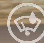
DÉTECTEUR DE PLUIE