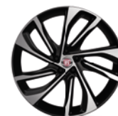
Jantes en alliage / Lichmetalen velgen Diamond Cut - 439 - de série sur / standaard op Sport en option sur / optie op Lounge & S-Design