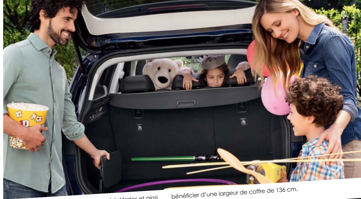
Une seule main suffit pour ôter les parois latérales et ainsi bénéficier d'une largeur de coffre de 136 cm.