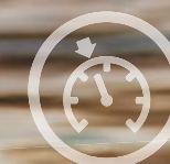
RÉGULATEUR DE VITESSE ADAPTATIF LIMITEUR DE VITESSE