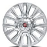
Jantes en tôle Stalen velgen 4WQ - de série sur / standaard op Pop