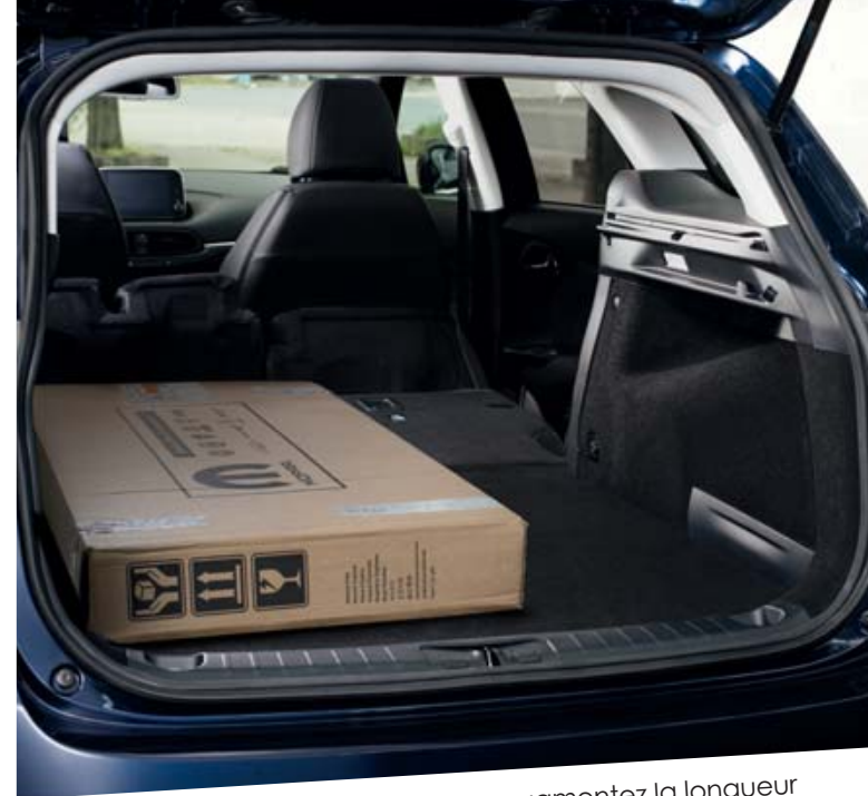
En rabattant les sièges arrière, vous augmentez la longueur du compartiment jusqu'à 180 cm.