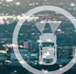
DÉTECTEUR DE LUMINOSITÉ