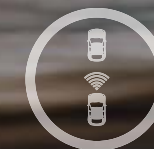
SYSTÈME DE FREINAGE D'URGENCE AUTONOME

Tous les modèles de la famille Tipo disposent d'équipements de série permettant de garantir votre sécurité, dont six airbags, l'ABS et l'ESP, avec MSR et antipatinage, sans oublier le système HBA (assistant électro-hydraulique de freinage), l'aide au démarrage en côte et le système de contrôle de la pression des pneus. Découvrez une nouvelle façon de voyager en toute confiance grâce à nos systèmes d'aide à la conduite avancés (optionnels) qui se conforment à chaque instant à vos exigences et vous rendent la vie tellement plus facile. Outre des capteurs de stationnement et une caméra de recul permettant de faciliter les manœuvres en marche arrière, la Tipo dispose de détecteurs de pluie et de luminosité. Elle propose également un régulateur de vitesse adaptatif qui vous permet de fixer la vitesse que vous désirez puis de maintenir automatiquement la bonne distance de sécurité entre votre véhicule et celui qui vous précède ; ainsi qu'un système de freinage d'urgence autonome qui détecte les obstacles, comme les voitures devant vous, vous avertit des risques imminents et freine automatiquement si vous ne réagissez pas à temps. Vous disposez enfin d'un limiteur de vitesse vous permettant de ne pas dépasser la vitesse maximale que vous avez fixée.