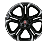
Jantes en alliage / Lichmetalen velgen MOPAR® Diamond Cut - 0R2 / 2WX- en option sur / optie op S-Design & Sport

Rosso Passione 6Y3 - 168 + Tetto Nero* OSB - 802