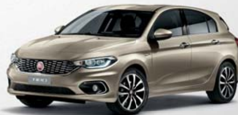
722 PERLA SABBIA MÉTALLISÉ