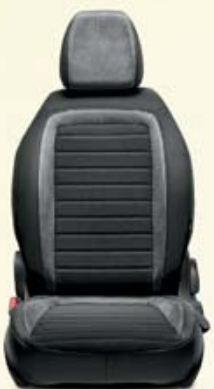
LOUNGE 4P Dégradé gris électrique