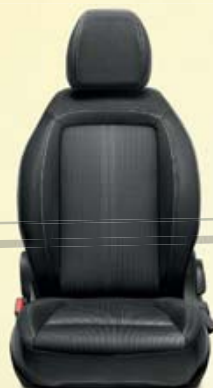
POP/EASY 5P/SW Noir et gris avec double couture