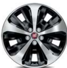
16" Eco version POP/EASY/LOUNGE 5P/SW