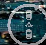
CAPTEUR DE STATIONNEMENT