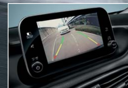
CAMÉRA DE REcul