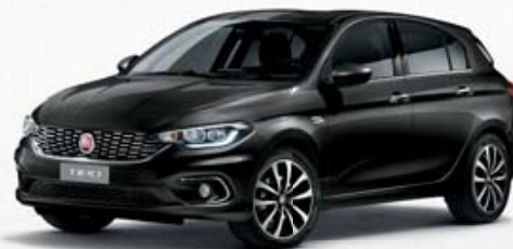
718 NERO CINEMA MÉTALLISÉ