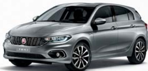
612 GRIGIO MAESTRO MÉTALLISÉ