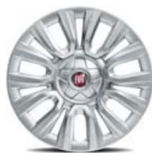
15" POP/EASY/LOUNGE 5P/4P/SW