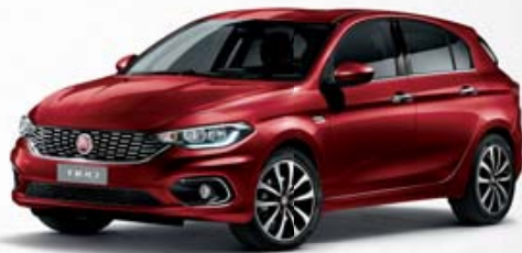
716 ROSSO AMORE MÉTALLISÉ