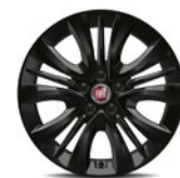
Jantes en alliage Lichmetalen velgen Street Black 1M3 - de série sur / standaard op Street