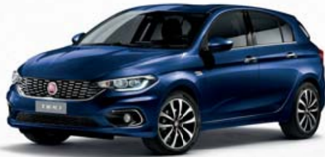
717 BLU MEDITERRANEO MÉTALLISÉ