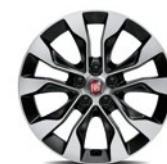
Jantes en alliage Lichmetalen velgen Diamond Cut 1M4 - de série sur / standaard op Mirror