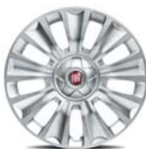
16" POP/EASY/LOUNGE 5P/4P/SW