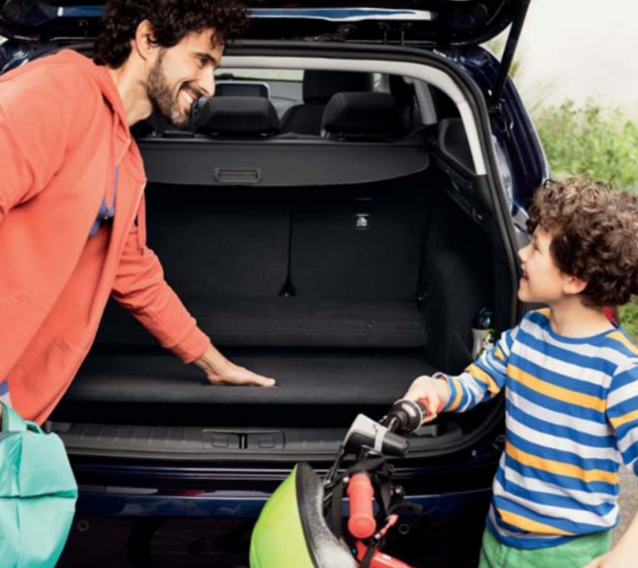
Vous pouvez disposer d'un compartiment à bagages plus haut en positionnant d'une seule main la plateforme Magic Cargo Space au niveau le plus bas.