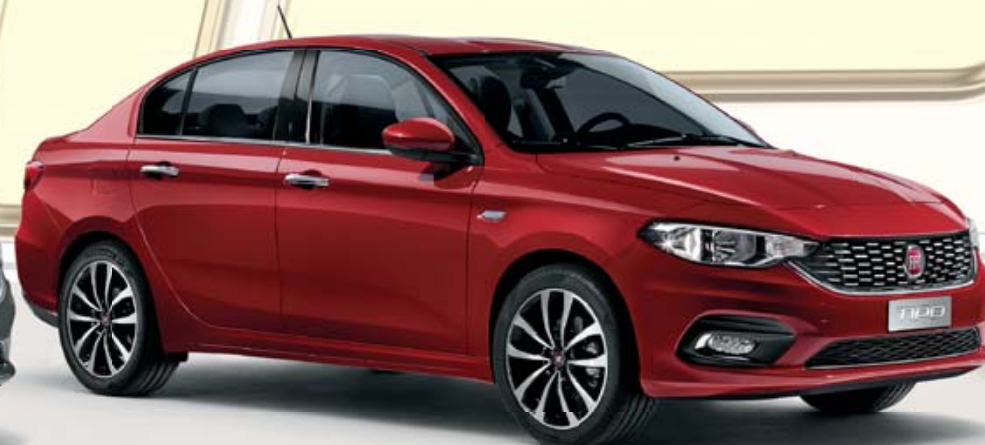
TIPO 4 PORTES