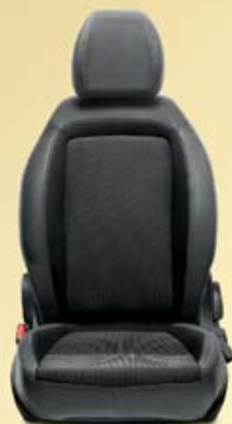
POP/EASY 4P Ondulations structurées gris foncé