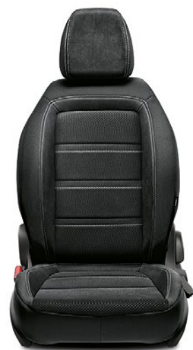
645 LOUNGE Tissu / Stof Ripse Black