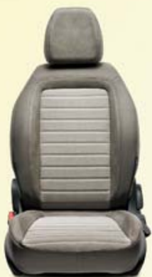
LOUNGE 4P Dégradé beige électrique