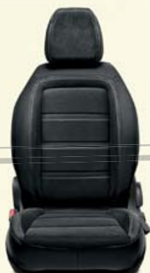
LOUNGE 5P/SW Couleurs foncées avec inserts Castiglio noir et double couture