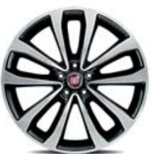
17" POP/EASY/LOUNGE 5P/4P/SW