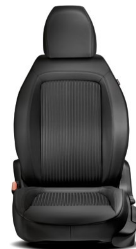
879 - S-DESIGN / SPORT Cuir - Tissu Airtex / Leder - Airtex-Stof Black