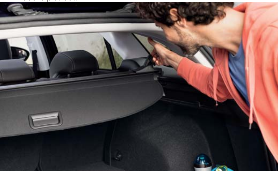
Le cache-bagage avec enrouleur se retire facilement d'une seule main.