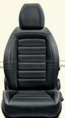
LOUNGE 5P/SW Cuir technique noir