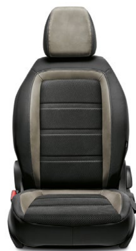
301 LOUNGE Tissu / Stof Black / Beige