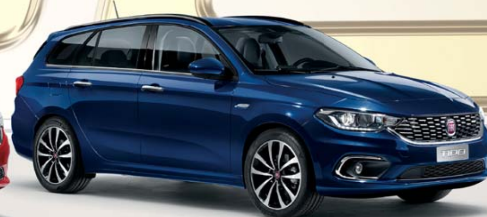
TIPO STATION WAGON

Avant, si vous vouliez plus d'équipements dans une voiture, il vous fallait payer plus. Mais tout cela est sur le point de changer. La nouvelle famille Tipo bouleverse la donne en proposant des voitures mieux équipées au même prix. Comment est-ce possible ? C'est très simple : Tipo vous offre tout ce dont vous avez besoin, sans superflu.