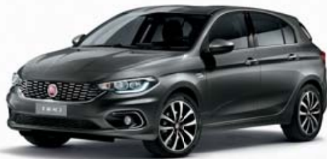
695 GRIGIO COLOSSEO MÉTALLISÉ