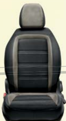
LOUNGE 5P/SW Couleurs claires avec inserts Terralight Castiglio et double couture