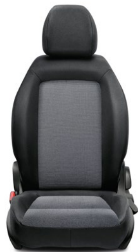
030 - POP / STREET Tissu / Stof Antracite Knit