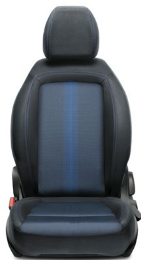
049 - MIRROR Tissu / Stof Skyline Black/Blue