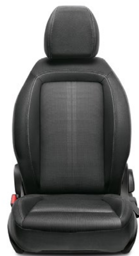
519 - MIRROR Tissu / Stof Skyline Black/Grey