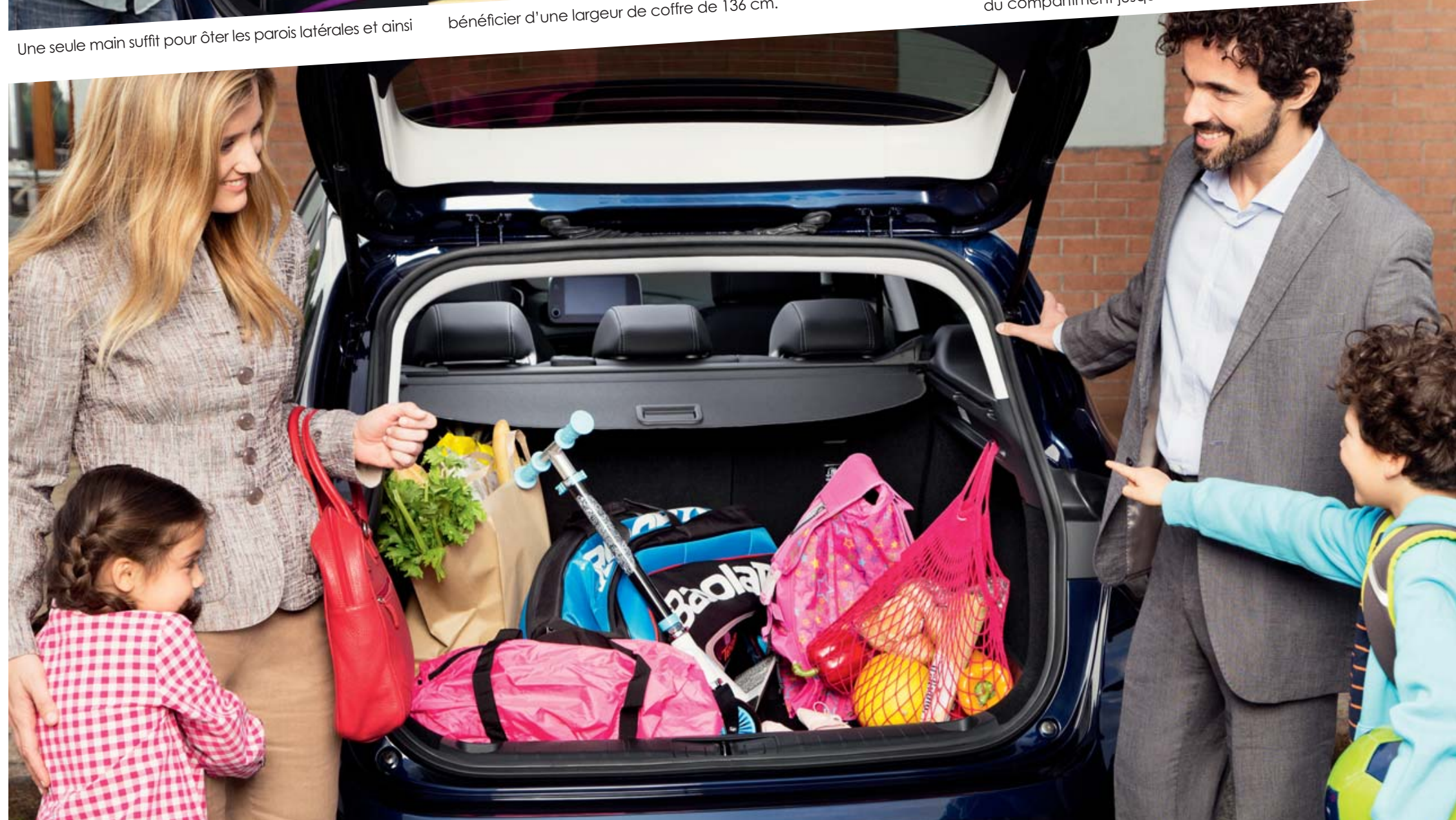
Lorsque vos sièges sont en position normale, votre coffre dispose d'un volume de chargement de 550 litres.