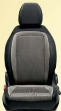
POP/EASY 4P Ondulations structurées grises