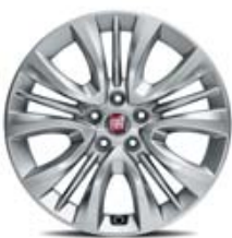
16" POP/EASY/LOUNGE 4P