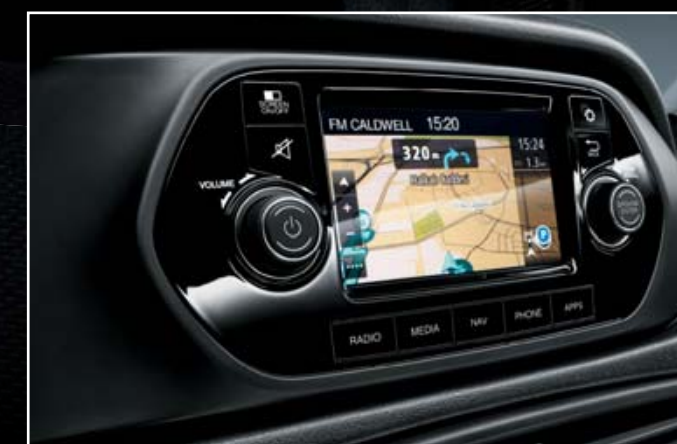
ÉCRAN TACTILE UCONNECT™ 5"