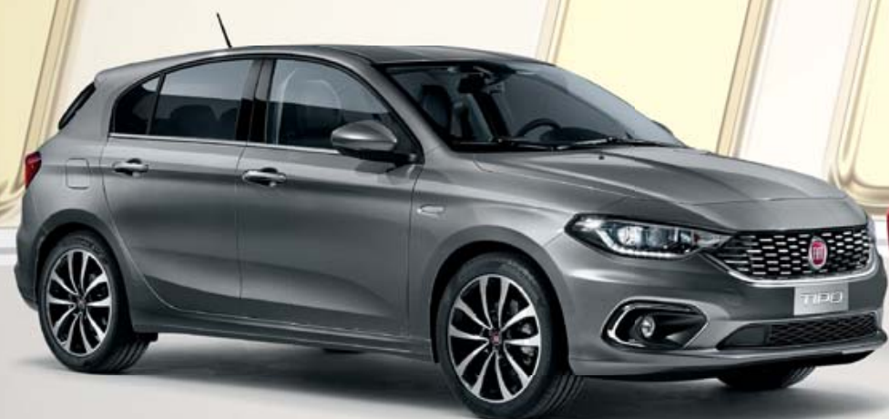
TIPO 5 PORTES